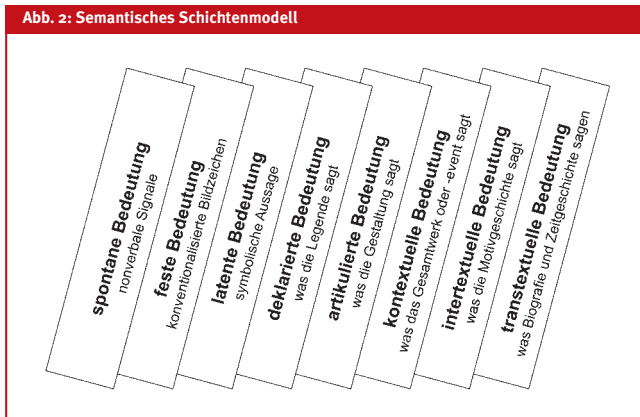
Abb. 2: Semantisches Schichtenmodell

Wahrnehmung ist ein subjektiver Vorgang, der zu einem großen Teil vom Persönlichkeitsprofil des Wahrnehmenden bestimmt wird. Den ersten Schritt in der Bilderschließung nennen wir deshalb subjektive Bedeutung. Ihr ist unbedingt und vorrangig Raum zu gewähren, denn in ihr erweist sich der existenzielle Bezug zwischen Bild und Betrachter.